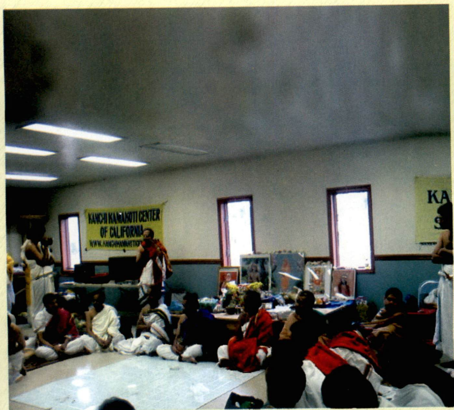
H.H. PujyaSri Maha Perivaa's 10th Aradhana in Bridgewater Temple, NEW JERSEY U.S.A. on December 20, 2003.